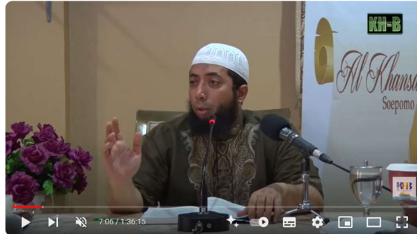
Mahkota Pengantin #7 : Landasan Memilih Suami - Khalid Basalamah

beberapa landasan utama yang harus menjadi pertimbangan utama dalam proses memilih suami, yakni agama, kemampuan finansial, sifat belas kasih, penampilan, usia, kesepadanan, dan kesesuaian budaya serta ibadah (Asy-Syuri 2009).