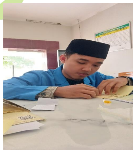
Menempel foto-foto di buku nikah dan akte nikah