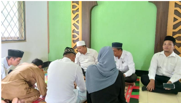
Menghadiri pernyataan memeluk agama Islam di kantor KUA