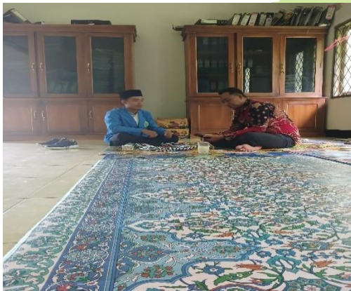
Pemberian arahan dan bimbingan dari kepala KUA