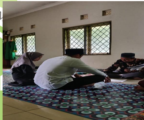
Mendampingi kepala KUA pada acara tajdid nikah