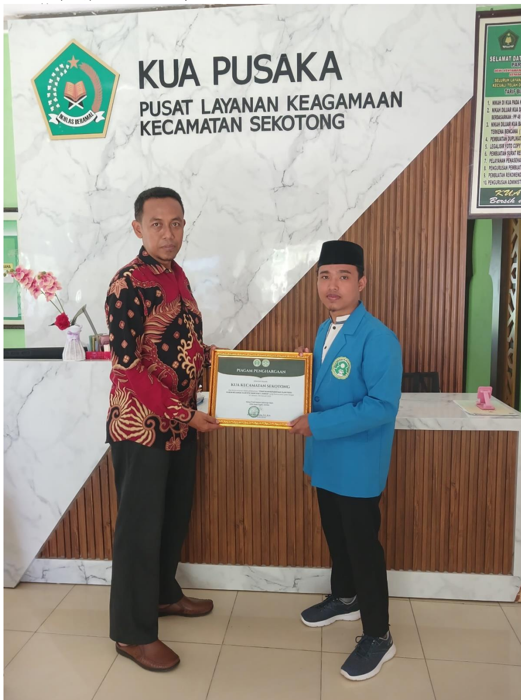
Pemberian PIAGAM PENGHARGAAN kepada kepala KUA Kec. Sekotong

a) Pengutipan hanya untuk kepentingan pendidikan, penelitian, penulisan karya ilmiah, penyusunan laporan, penulisan kritik atau tinjauan suatu masalah.