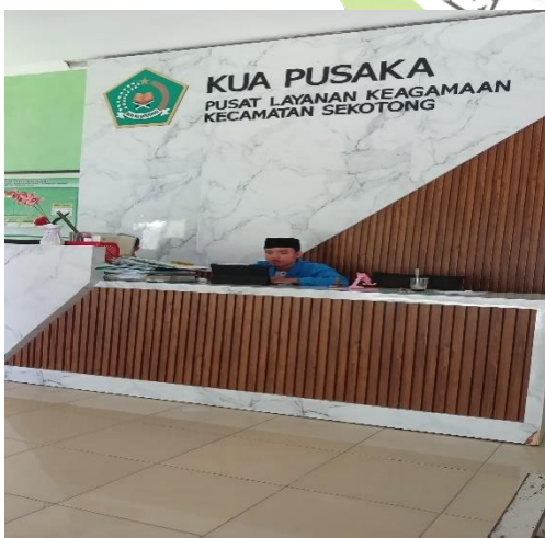
Menjadi Administrasi di KUA