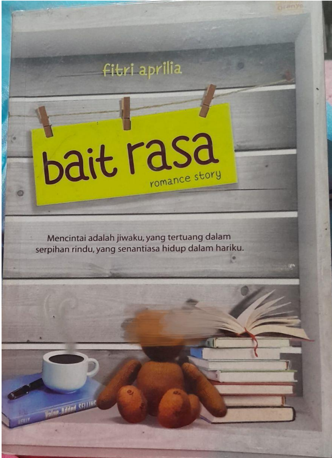
صورة ٢٥: الرواية الرومانسية المطبوعة