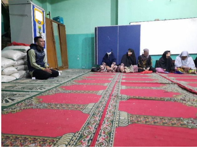
البرنامج الديني (محاضرة دينية)