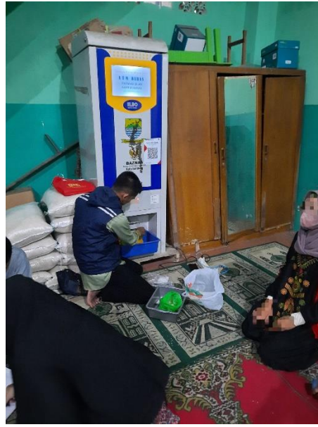
أخذ العامل الأرز لإعطائه إلى المستحق