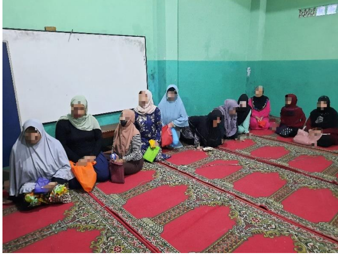
الطبور لأخذ الأرز من آلة الصراف الآلي للأرز