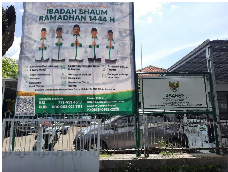
مكتب وكالة الزكاة الوطنية مدينة باندونغ جاوة الغربية