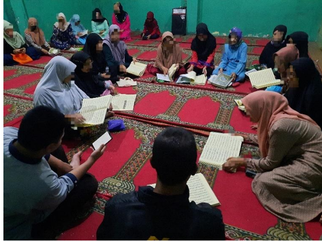
البرنامج الديني (خلقة قراءة القرآن)