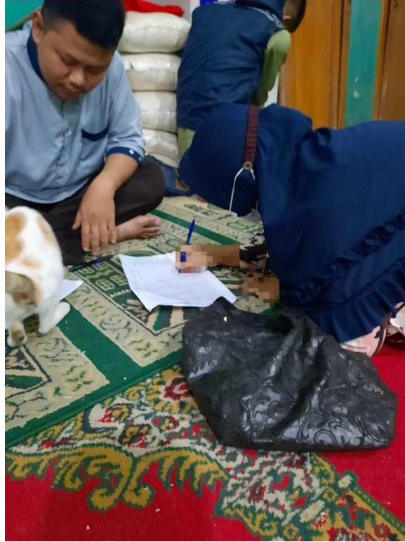
وقع المستحق بعد تسليم الأرز