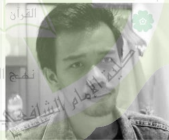
Melodio Fajar GRAPHICS & VIDEO