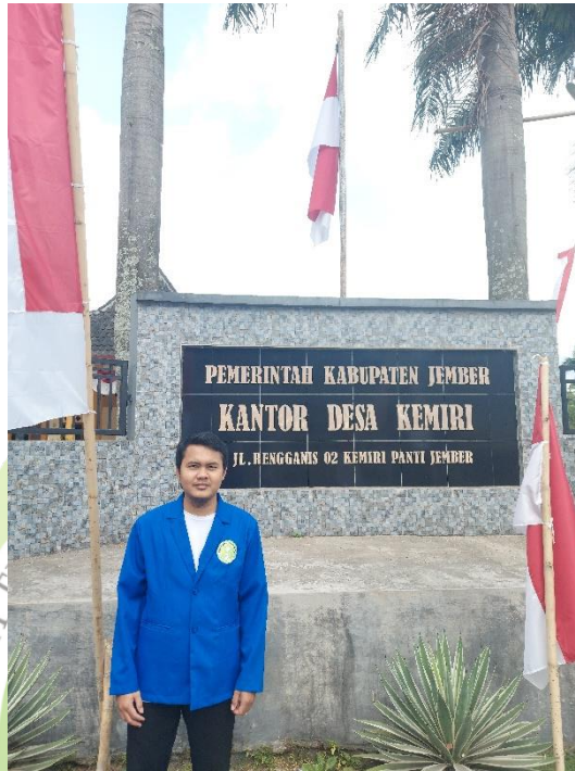
Depan Kantor Desa Kemiri, Kabupaten Jember