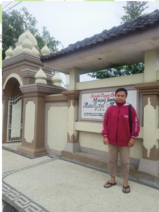
الباحث في مسجد التاريخي الحمي مسجد جامع روضة المتقين في قرية كوتاراجا